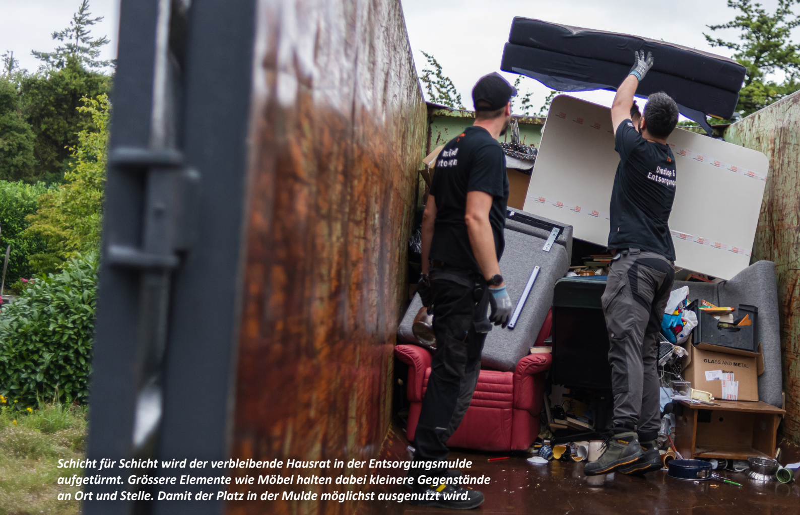
Schicht für Schicht wird der verbleibende Hausrat in der Entsorgungsmulde aufgetürmt. Grössere Elemente wie Möbel halten dabei kleinere Gegenstände an Ort und Stelle. Damit der Platz in der Mulde möglichst ausgenutzt wird.