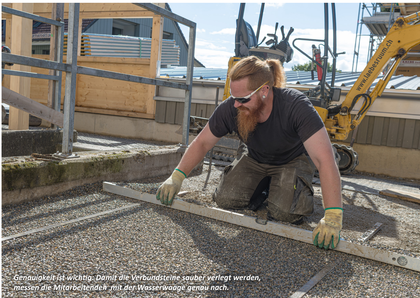
Genauigkeit ist wichtig: Damit die Verbundsteine sauber verlegt werden, messen die Mitarbeitenden mit der Wasserwaage genau nach.