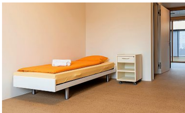
Eines der wenigen Einzelzimmer im Haus Orange, natürlich mit orangefarbener Bettwäsche.

Die Kantonspolizei Zürich bitet Frauen, die sich am 1. März zwischen 15 und 15.45 Uhr in den Garderoben und Duschen der Sportanlage Steinacker in Winterthur befinden haben, sich zu melden unter: info@kapo.zh.ch (bei Fragen Telefon 058 648 48 48). (dwo)