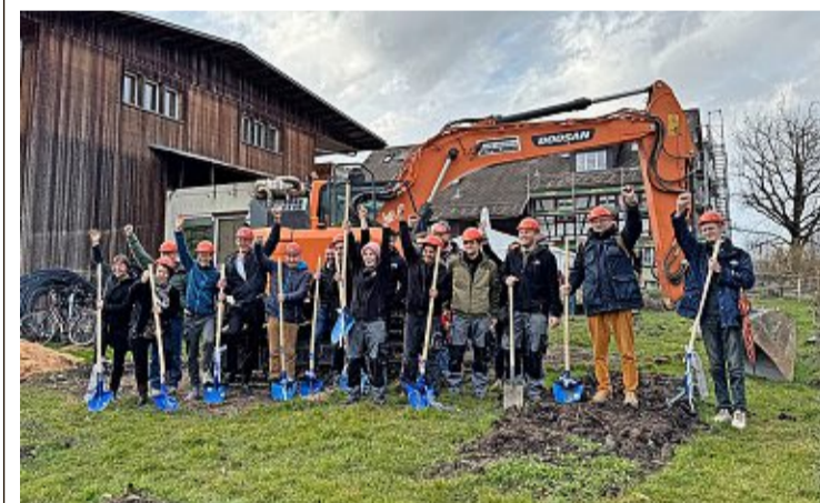
Am Donnerstag fand der Spatenstich statt.