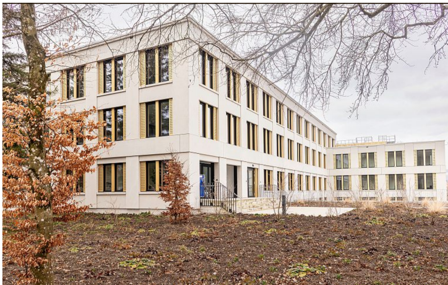
Das neue Haus Orange der IPW in Winterthur bietet Raum für 124 Personen.